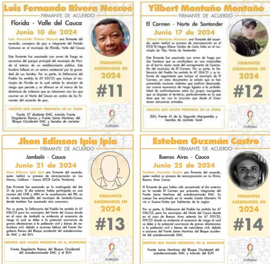
IMAGEN 6. PUBLICACIÓN HOMICIDIOS DE FIRMANTES EN EL MES DE JUNIO DE 2024

Al analizar el siguiente mes con mayores afectaciones, es decir junio, es posible evidenciar un aumento en la cantidad de afectaciones a PPR, que tiene las siguientes particularidades: