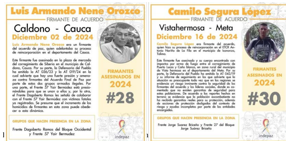
IMAGEN 8. PUBLICACIÓN HOMICIDIOS DE FIRMANTES EN EL MES DE DICIEMBRE DE 2024

La confrontación se concentra sobre todo en el bajo Putumayo, abarca municipios como Orito, Valle del Guamuez, Puerto Asís, Puerto Caicedo, San Miguel y Puerto Leguizamo. En esta última localidad, el río Putumayo se ha convertido en un punto estratégico clave, ya que su control facilita la salida hacia la región amazónica y el acceso a laboratorios ubicados en Puerto Leguizamo 30 . Por otro lado, en el foco configurado en el norte del país encontramos presencia de Frente 18 del GAO-r bajo las órdenes de la Segunda Marquetalia, Frente 36 y Frente 37, las Autodefensa Gaitanistas, los Caparrós y el ELN. Por último, en el centro oriente del país es posible evidenciar el acaecimiento de tres afectaciones en contra de PPR como lo refleja la siguiente imagen: