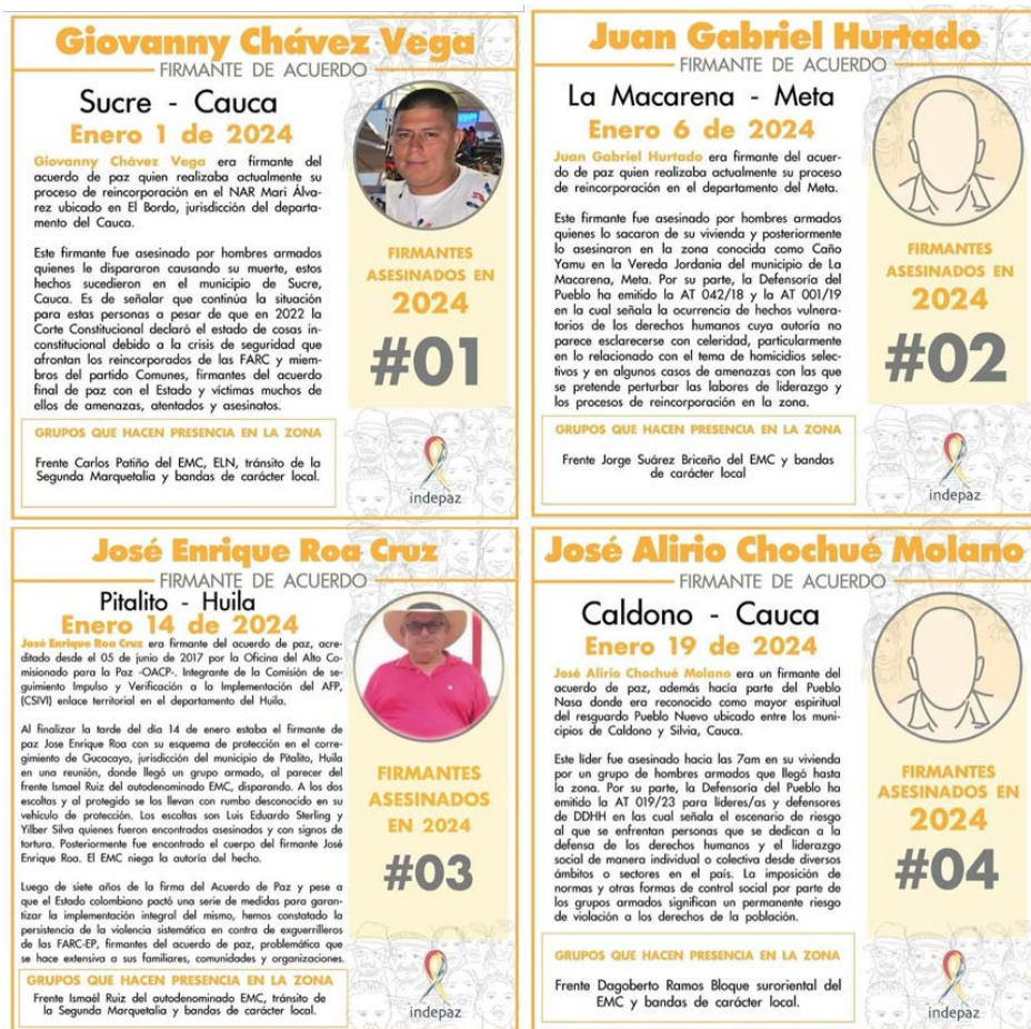
IMAGEN 5. PUBLICACIÓN DE HOMICIDIOS DE FIRMANTES EN EL MES DE ENERO DE 2024