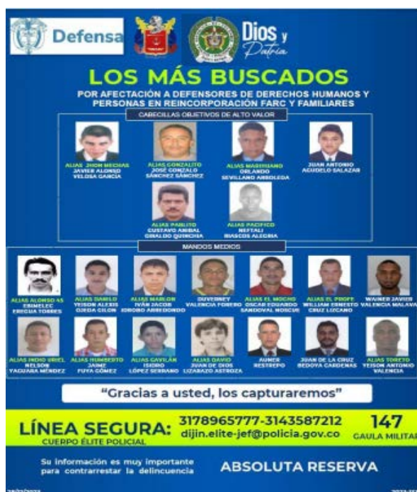
IMAGEN 3. VOLANTE DE LOS MÁS BUSCADOS EN EL MARCO DE LA ESTRATEGIA “THEMIS”