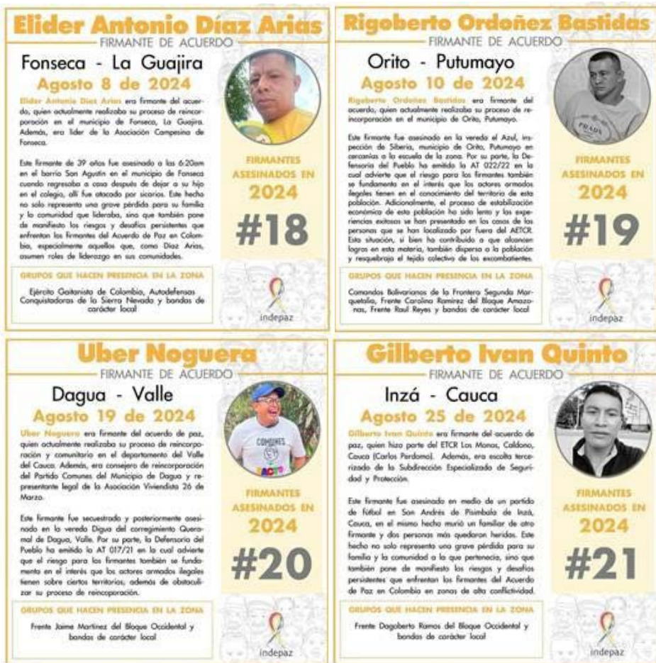
IMAGEN 7. PUBLICACIÓN HOMICIDIOS DE FIRMANTES EN EL MES DE AGOSTO DE 2024